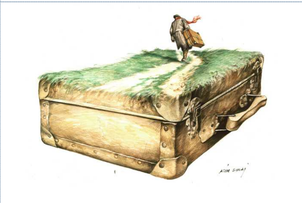
Uma das imagens (Agim Sulaj, da Itália)