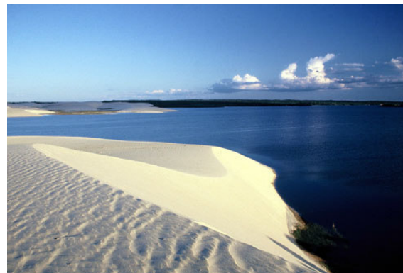
Lewi Moraes fotógrafo brasileiro.