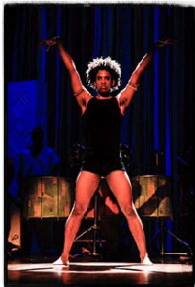
Makala Música & Dança no espetáculo Terra.